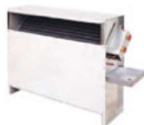
立式暗装风机盘管