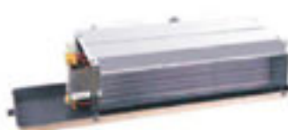
卧式暗装风机盘管