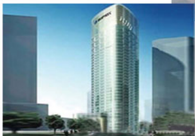
上海未来资产大厦