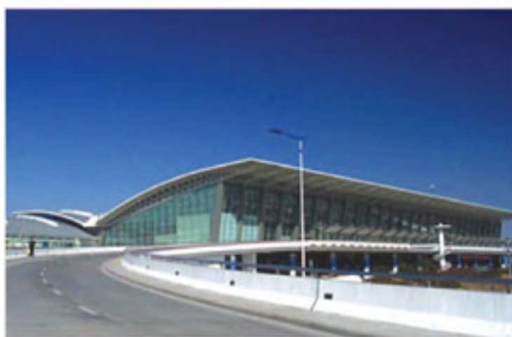
西安飞机场候机楼