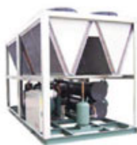
风冷螺杆式冷水(热泵)机组