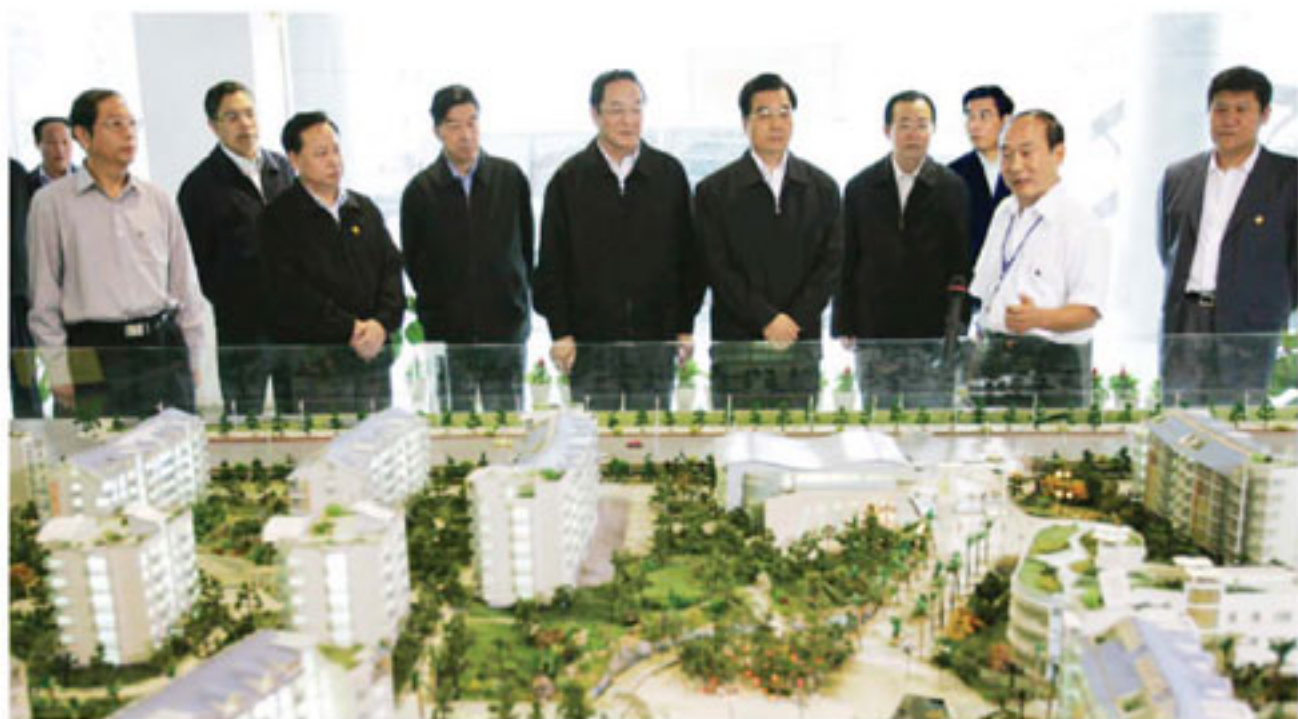
国家领导人视察的武汉节能典范小区：绿景苑小区(该小区使用三燕中央空调设备)