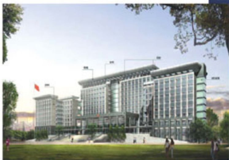
江西上饶行政中心