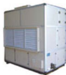
恒温恒湿空调机组