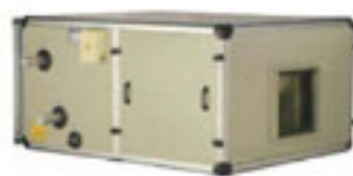
吊顶式空气处理机