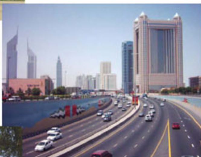
迪拜超豪华五星级酒店