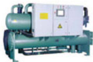
满液式水冷螺杆冷水机组